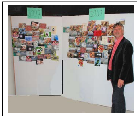
Het maken van moodboards